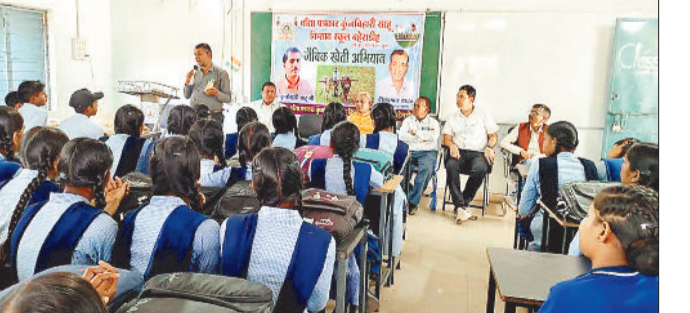
छात्र-छात्राओं को जैविक खेती व जल संरक्षण की जानकारी देते किसान स्कूल के संचालक।

■ पं. रामसरकार पांडेय शासकीय उच्चतर माध्यमिक विद्यालय कुकरा में जागरूकता कार्यक्रम आयोजित