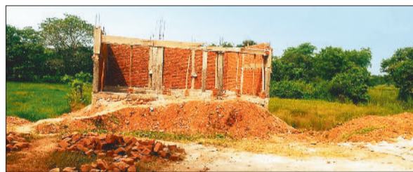
शासकीय भूमि पर बेजाकब्जा कर बना रहे मकान।

कार्रवाई की है। बताया जाता है कि पुछेली में लंबे समय से अवैध रेत उत्खनन चल रहा है। अवैध रेत उत्खनन पर चाम्पा एसडीएम पवन कोसमा और बम्हनीडीह