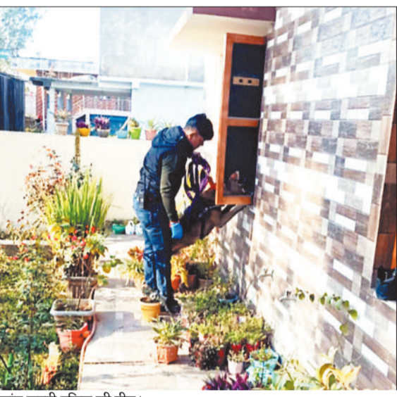
जांच करती पुलिस की टीम।