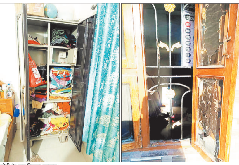
चोरों के बाद बिखरा सामान।