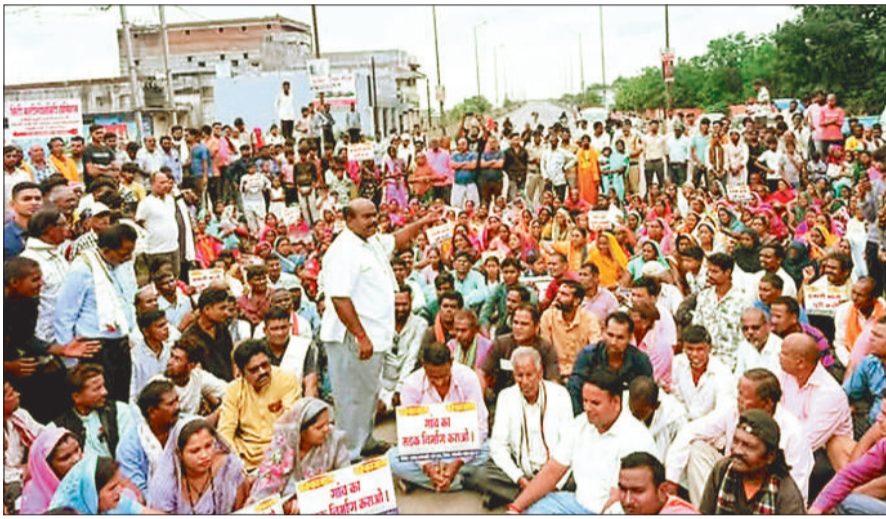
सड़क की मांग को लेकर विधायक के साथ चक्काजाम करते ग्रामीण।

वहीं दूसरी ओर मामले में निजी एम्बुलेस चालक की रिपोर्ट पर